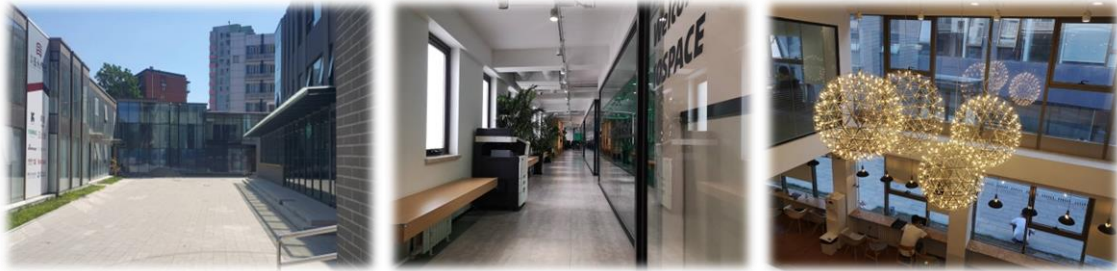
北京東直門.萌想科技北京辦公室

而這段實習經歷中，如同校園課堂上的學習， 最大的成就並不是職能上的專業技能與成績，而是人際上拓展伴隨而來的收穫 ，儘管在平日工作激烈競爭、繁忙的環境下，工作外與同事仍可以相互玩笑、吃喝玩樂朋友般的相處，也是我北京交換生涯中一頁精彩。