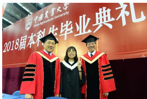
圖一、中農大畢業典禮(左為副書記，右為校長)