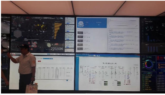
圖八、牡丹國企的參訪情形:利用互聯網進行調查消費者的行為分析)