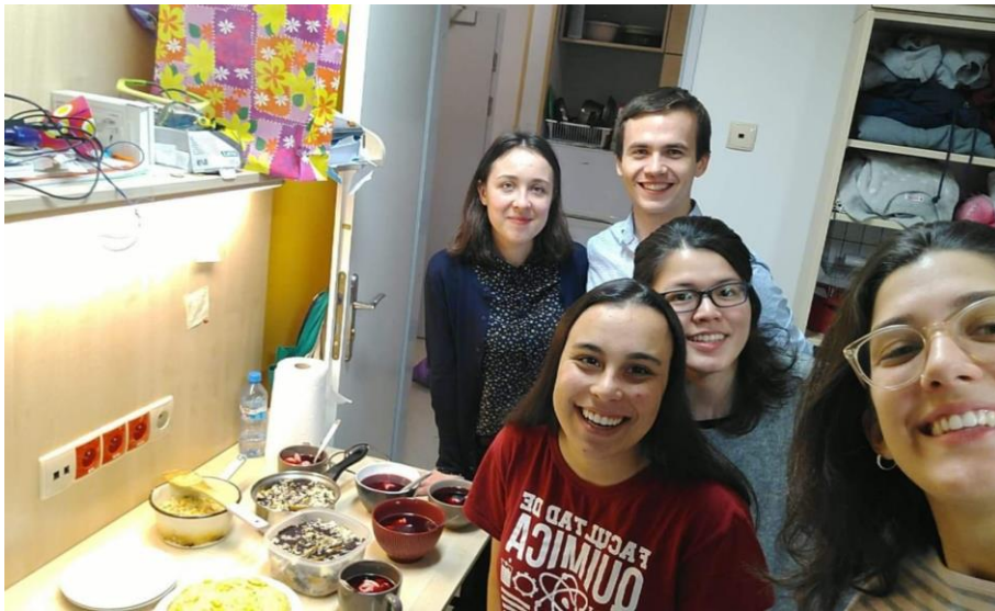
▲ 在宿舍和朋友們(來自波蘭、西班牙、巴西)一起煮的國際版 Xmas Dinner

選擇住宿除了交通便利，還能接觸來自各地的國際學生，因鄰近波蘭，來這裡念學位的烏克蘭、白俄羅斯的學生占多數，交換生則是西班牙、義大利及土耳其學生為大宗，透過日常交流，參加過烏克蘭、西班牙的寢室聚會，各異其趣。