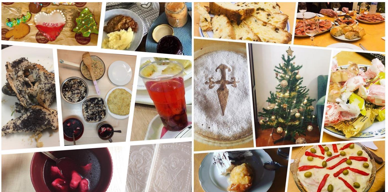
▲ (左)波蘭 Xmas Dinner: 12 道特殊料理 (右)西班牙 Xmas Dinner: 海鮮大餐

出來交換若只當成換個地方上課，未免有些遺憾，於我而言，交換就是體驗並融入當地文化，而在這之中，首當其衝即是飲食，除了和不同國家的朋友一起煮飯、參加交換生的 International Dinner 品嚐各國家鄉味，更在波蘭及西班牙嘗到了聖誕限定料理！過程中，我們分享了某些料理背後的由來也學到各國語言，讓我跳脫傳統從冰冷文字去認識國家，而是從有溫度的飲食文化實際了解該國風情。