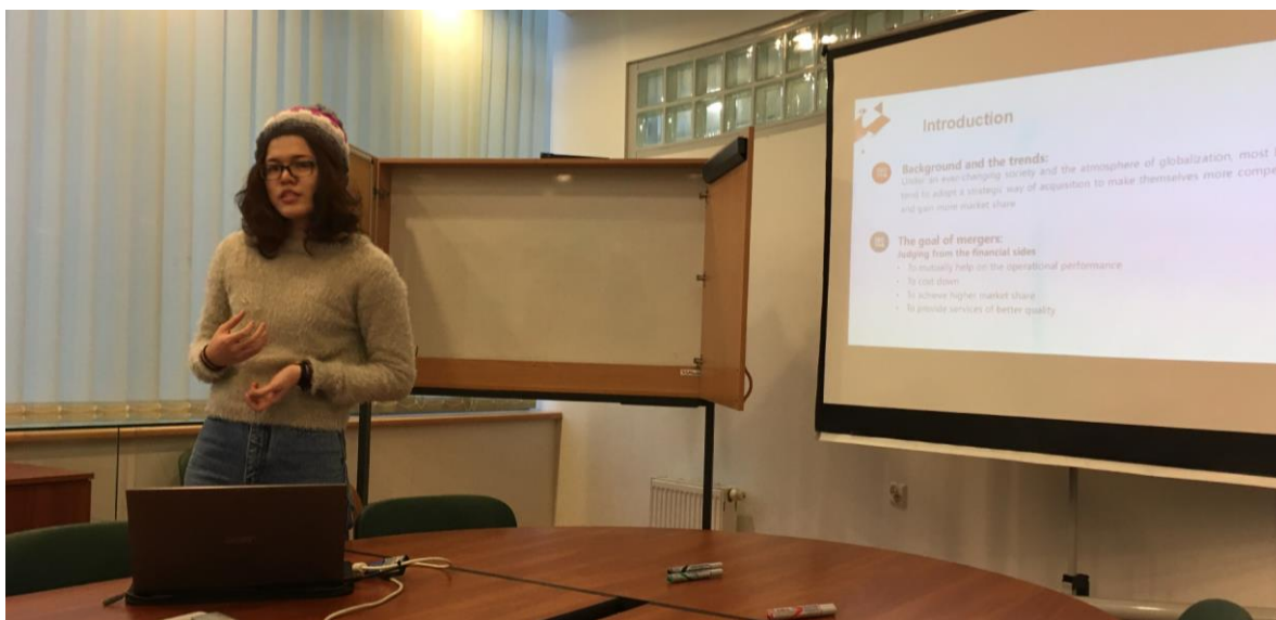
▲ 研討會課堂個人報告

除了修習一般性課程，交換時也想參與當地的研討會，體驗不同的討論課文化，所以選了 Seminar，在這裡課堂上沒有固定要看的論文篇章，而是將自己的論文與師生討論，而這樣的上課方式，除了在報告自己的論文時能得到回饋並加以修正，同時也能從同學們的報告裡吸收新知、獲得不同靈感。