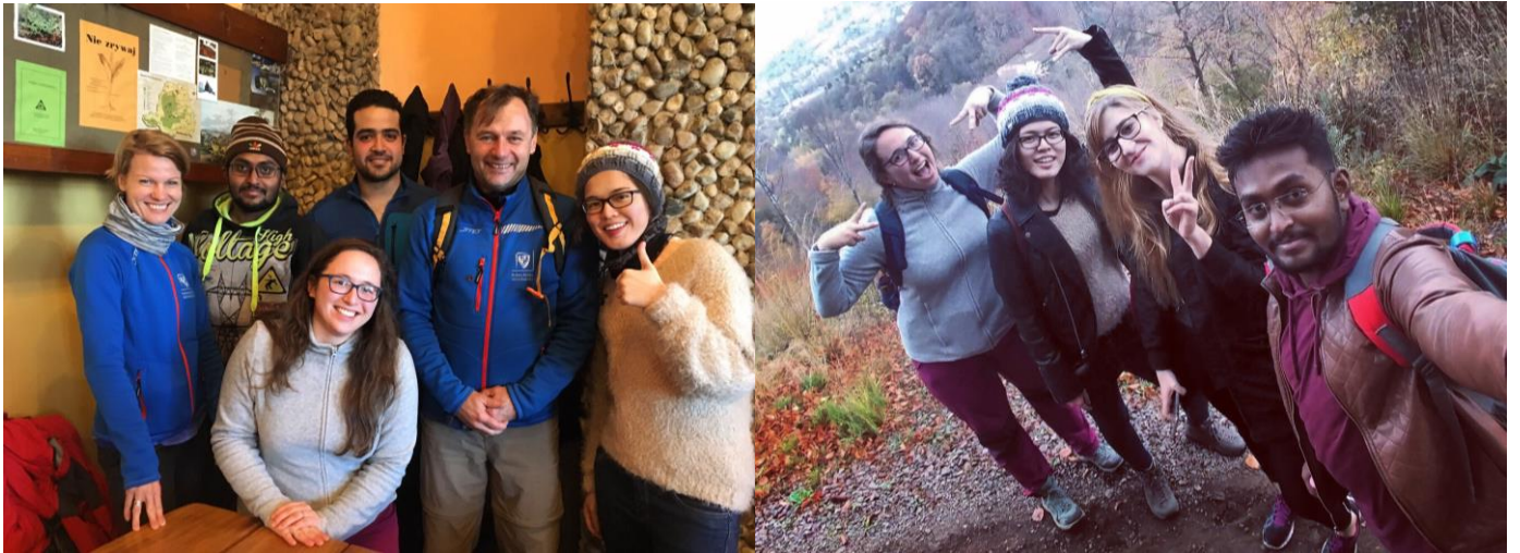
▲ Hiking 課的老師及同學們(來自印度、波蘭、埃及、法國)