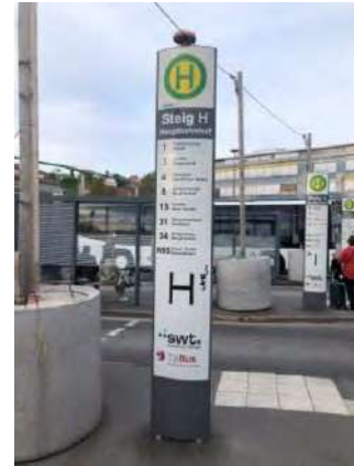
車站外的公車站牌