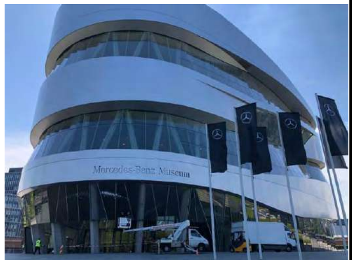
德國 斯圖加特 賓士博物館