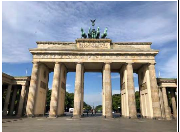
德國 柏林 布蘭登堡門