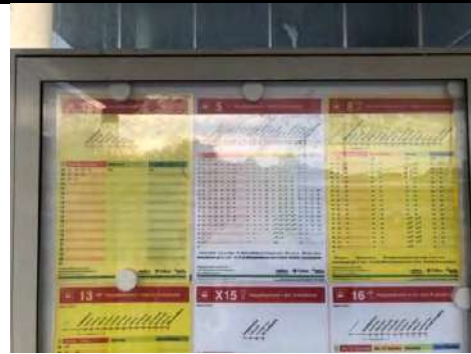
公車的時刻表與路線